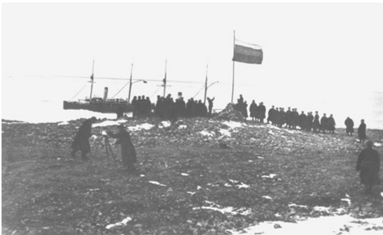
Рисунок 4. Подъём русского флага на Земле Николая II (Северной земле).

16 сентября 1915 года первое сквозное плавание Северо-Восточным проходом с востока на запад было завершено. На Соборной пристани Архангельска участникам экспедиции была устроена торжественная встреча, на которой присутствовало все гражданское и военное губернское начальство. Через год после окончания экспедиции