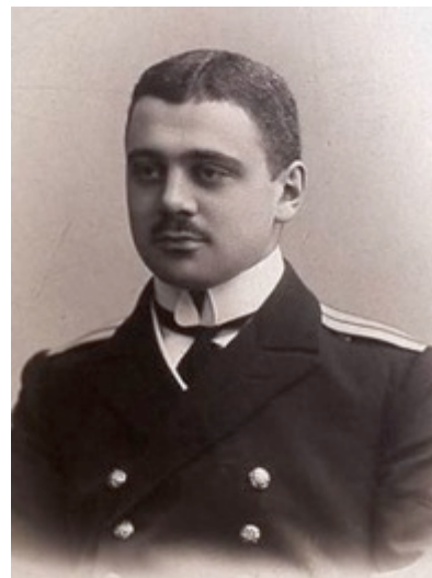
Рисунок 3. Капитан Б.А. Вилькицкий

Исследования и географические открытия русских моряков пополнились успехами гидрографической экспедиции 1913-1915 гг. на двух ледоколах «Таймыр» и «Вайгач», начальником которой стал тогда молодой морской офицер – гидрограф, капитан II ранга Борис Андреевича Вилькицкий (1885 -1961). В ходе экспедиции было открыто несколько новых островов – Северная земля (Земля Николая II), Малый Таймыр, Старокадомского, Жохова. Были составлены карты и лоции, отличавшиеся высочайшей точностью, проведены геологические, ботанические и зоологические работы, сделаны крупные географические открытия.