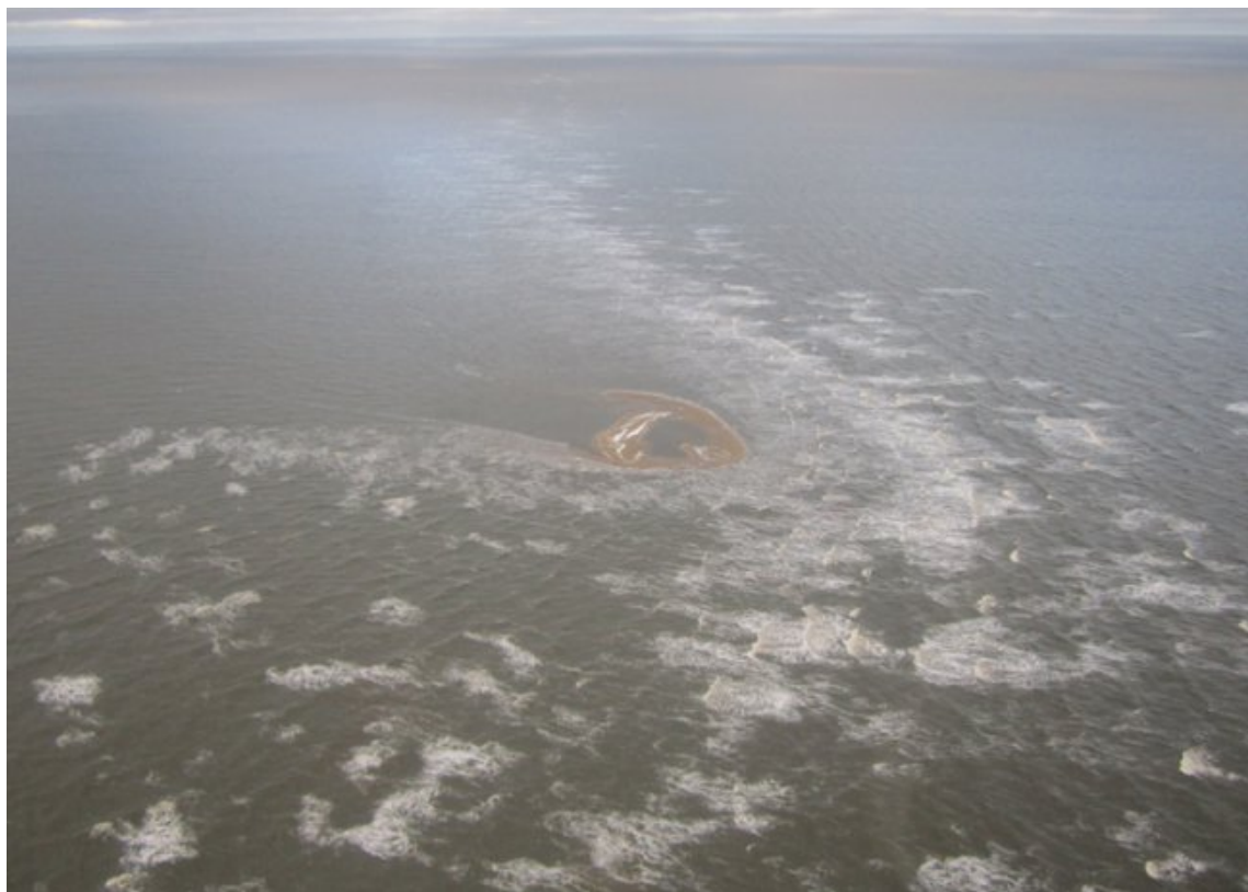
Рисунок 1. Остров Яя.

В XXI столетии в СЛО тают многовековые ледники, открывая новые острова и мысы. Россия начинает прирастать новыми островами в Арктике, что реально увеличивает территориальные воды России, её особую экономическую зону (ОЭЗ) 1 .