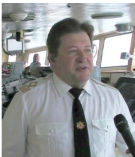
Рисунок 2. Капитан Александр Пышкин.

Подтвердить или опровергнуть географическое открытие удалось только через год. В августе 2014 года из Кронштадта в кругосветную экспедицию вышло