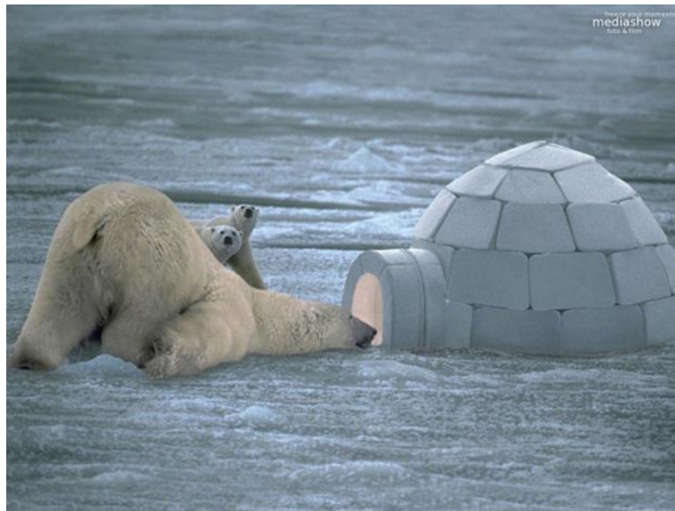
Рис. 2. Иглу эскимосов. URL: http://www.graycell.ru/picture/big/iglu.jpg ; http://ihoroshho.yomu.ru/wp-content/uploads/2013/01/iglu.jpg (дата обращения: 12.05.2013)